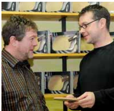
Welcher Belag soll es sein? Sport Vettermann gibt den Spielern Tipps