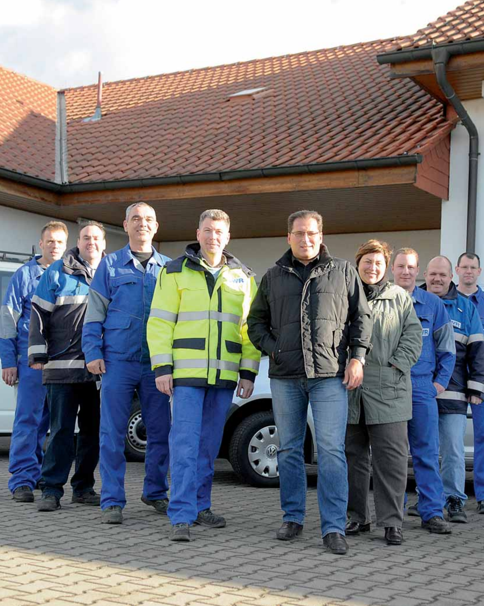
Das Team der Bezirksstelle Ried ist Ihr Ansprechpartner: in der Schillerstraße 41, 68623 Lampertheim-Hofheim, Tel. 06241 988180