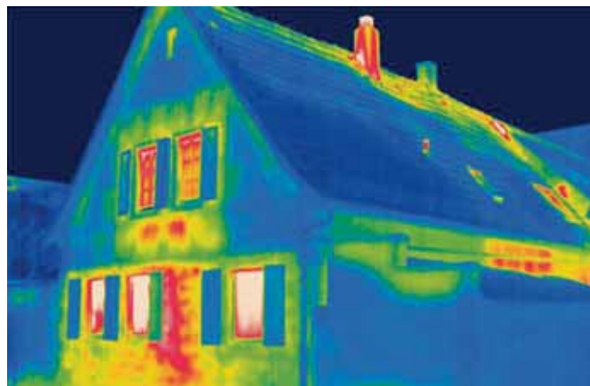
Die Aufnahmen einer Wärmebildkamera machen deutlich, wo die Gebäudehülle Schwachstellen hat

Ja, dafür werden beide Tests am häufigsten eingesetzt. Besonders in der Altbausanierung steckt ein großes Potenzial, um Energie zu sparen. Auch die Modernisierung der Heizungsanlage macht in vielen Fällen erst richtig Sinn, wenn zuvor die Gebäudehülle saniert wurde. Mit der Wärmebildkamera lassen sich deutlich Wärmeverluste an Wänden und Fenstern oder auch Bauschäden nachweisen. Und der Blower-Door-Test macht Zugluft messbar. Mit den somit gewonnenen Ergebnissen können wir dann dem Hausbesitzer detaillierte und sinnvolle Maßnahmen empfehlen, um sein Gebäude energetisch auf den neuesten Stand zu bringen. Und das ohne Schimmelbildung in der Wohnung – damit neben der Energiebilanz auch das Raumklima stimmt.