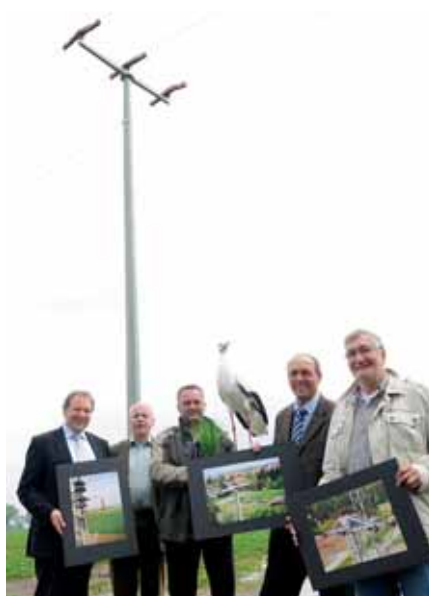
Vogelschutzwarte Frankfurt und EWR kooperieren bei den Maßnahmen zur Sicherung der Mittelspannung.

„Vogelschutzhauben“ und „Büschelabweiser“ an Strommasten schützen Eulen, Störche und Greifvögel: An den Strommasten und Anlagen der Mittelspannung kann es sonst zu einem Kurzschluss oder Erdschluss kommen – meist der sichere Tod für die Tiere. EWR hat daher sein Freileitungsnetz weiter umgebaut und investierte von 2007 bis 2010 zirka 200.000 Euro für Vogelschutzmaßnahmen im Ried. Zirka 270 Masten und Leitungsdurchführungen an Turmstationen wurden dabei umgerüstet. 90 Prozent der EWR-Maste in Hessen befinden sich in ausgewiesenen Vogelschutzgebieten. Der Gesetzgeber fordert den Abschluss der Sicherungsmaßnahmen gegen den Stromtod von Vögeln bis 2012. Darüber hinaus gibt es ausgewiesene Naturschutzgebiete wie in den Rheinauen mit höchster und hoher Priorität. Freileitungsanlagen in Regionen mit höchster Priorität sind 2010 auf Vogelschutz umzurüsten, die