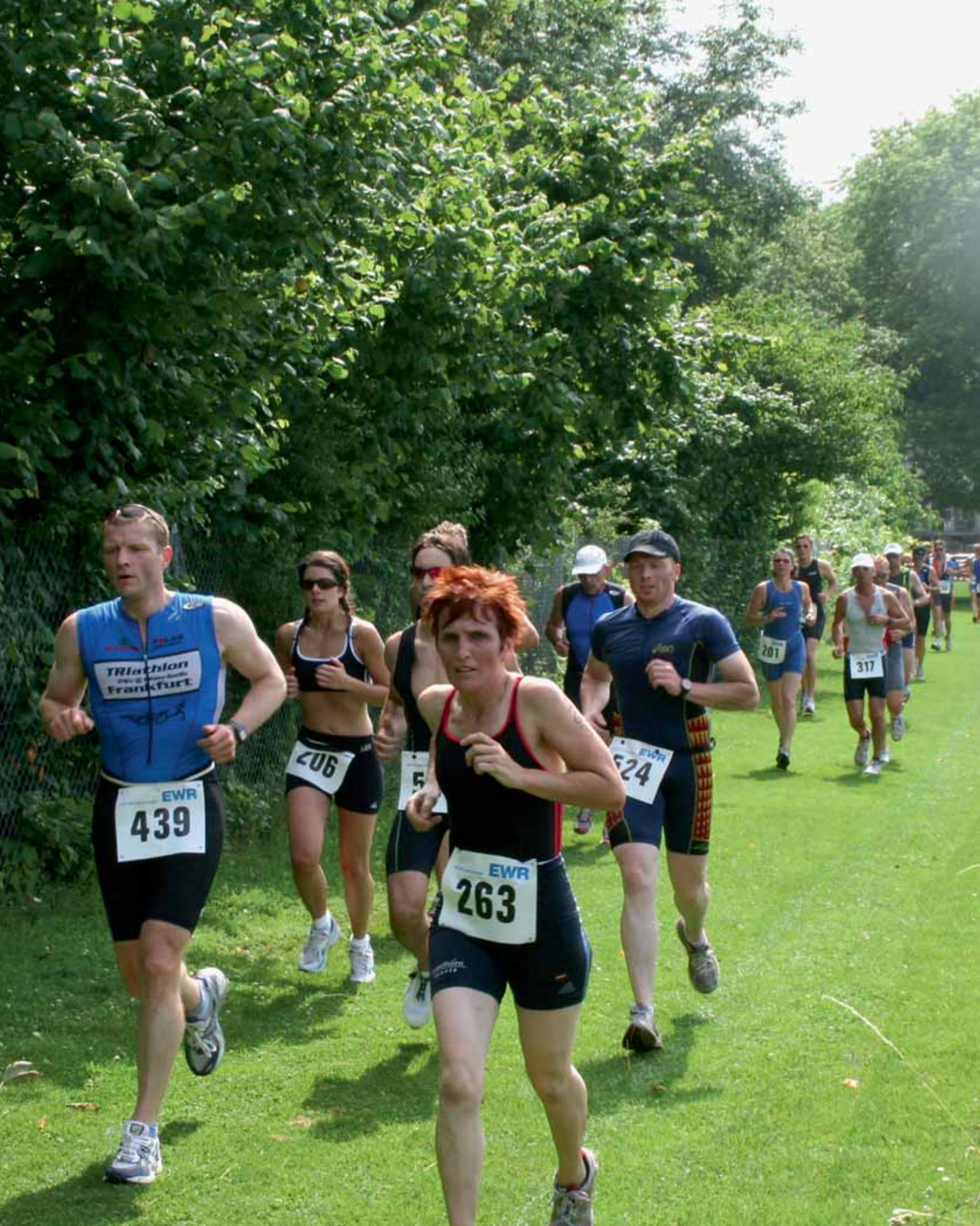
Mehr als 700 Teilnehmer werden am 27. Juni wieder schwimmen, Rad fahren und laufen: beim EWR-Triathlon in Lampertheim