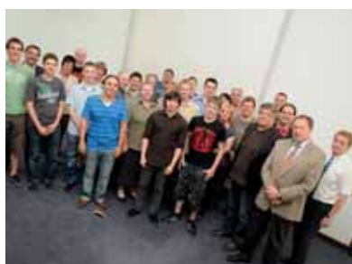
Oben die Mädels, unten die Jungs: am Girls' Day und Azubi-Tag