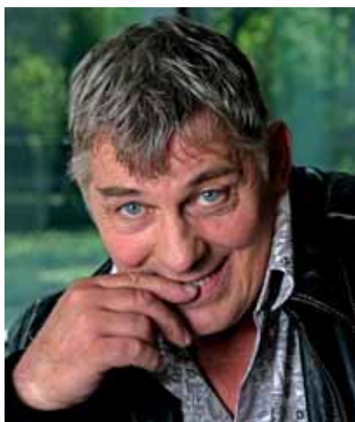
Heinz Hoenig improvisiert in Worms.

Für diesen ungewöhnlichen Versuch holt der Festspiel-Intendant wieder renommierte Theater- und Filmschauspieler nach Worms: Heinz Hoenig, Meret Becker, Dirk Bach, Peter Striebeck, Anouschka Renzi, Roland Renner und andere.