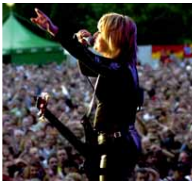
Zu Gast bei der Niersteiner Oldie-Sommernacht: Suzi Quatro

Bei diesem musikalischen Highlight werden bei den Fans und Besuchern mit Sicherheit wieder nostalgische Erinnerungen wach, denn schließlich sind die Weltstars – Live on Stage – vertreten. Ein Welthit und Ohrwurm jagt den