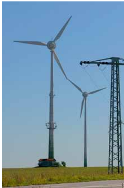
Mehr Windkraft bedeutet auch mehr Leistung im Stromnetz.

Auf diese Entwicklung stellt sich auch EWR ein und unterstützt die Gemeinden mit der passenden Infrastruktur: Zum