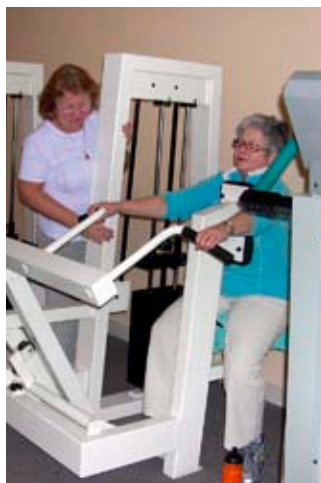
Machen Sie sich fit, Ladys – in Biblis sind Sie richtig!

In Biblis trainieren die „Ladys“ ganz unter sich – und die Kinder werden nebenan zuverlässig betreut. Ein Rundum-Service, der Lust macht, sich anzuschließen! Wo? Korngasse 2, Telefon 06245 209197, www.fitnesszentrum.org .