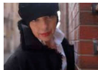
Helen Schneider präsentiert in Dexheim ihr neues Album