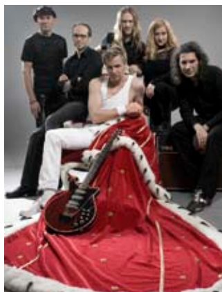
Die Queenkings haben sich als Coverband einen großen Namen erspielt

Queen-Covershow ein. Der Abschluss des ersten Open-Air-Wochenendes ist für Helen Schneider reserviert. Der Weltstar aus den 80er Jahren hat ein neues Album aufgenommen und möchte an die Erfolge früherer Zeiten anknüpfen. Infos und Karten unter www.kulturaufdemhof.de .