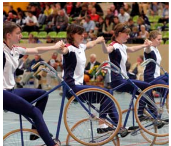
In Worms am Start: der 4er der VfH-Juniorinnen