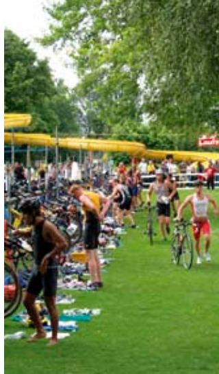
„Wechselzone“ beim Triathlon rund um die Biedensand-Bäder

Wer sich aber nur aufs Laufen spezialisiert hat, der sollte sich den 31. Mai vormerken: Beim EWR Spargellauf werden 5, 10 oder 21 Kilometer absolviert, Bambinis und Schüler laufen 900 bzw. 1.800 Meter. Das „fitte Gemüse“ ist online unter www.spargellauf.de zu finden.